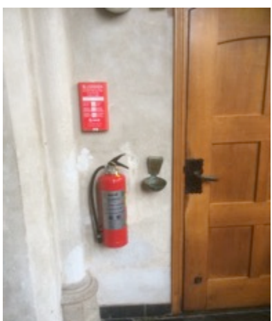
brandblusser (3 stuks)