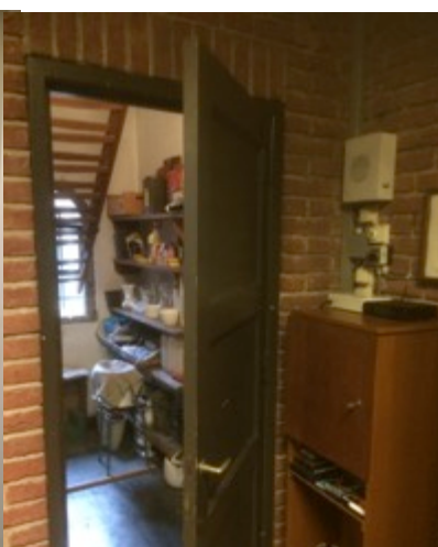
toegang meterkast en verwarmingsketel (zolder)